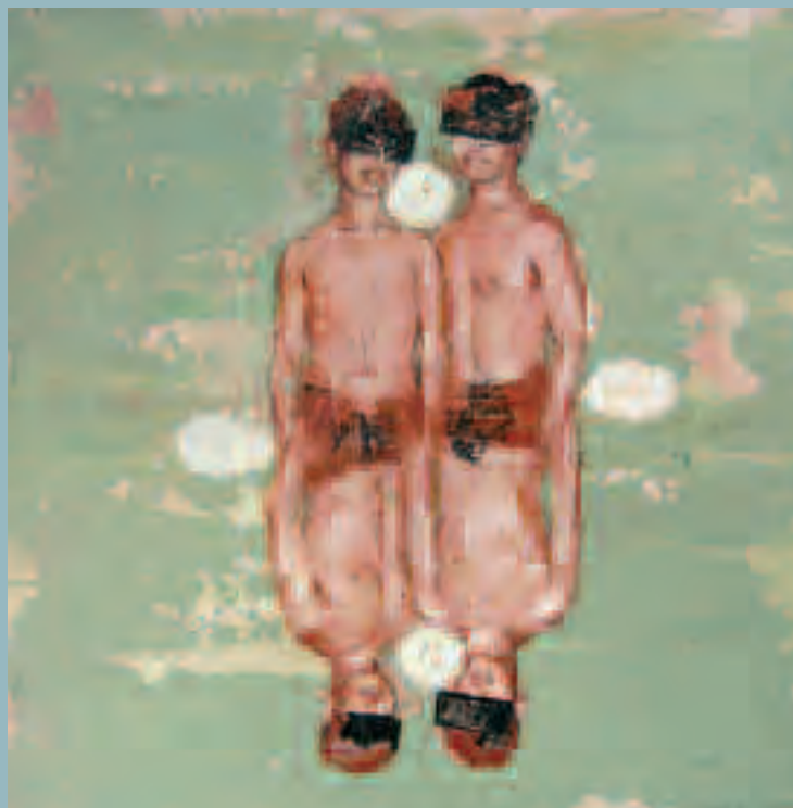
In 2006 waren er ruim 7.000 meldingen van kindermishandeling. Een verdubbeling op tien jaar tijd.